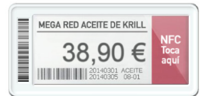
Super Slim 2.9"