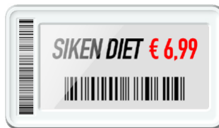
Super Slim 2.1"