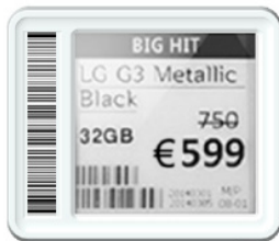
Super Slim 1.5"